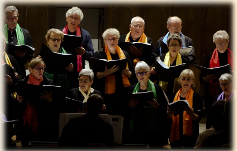
Photo concert à Bazoilles et Ménil

La chorale Chœur à Cœurs vous adresse tous ses meilleurs souhaits de santé, bonheur et paix et vous présente ses meilleurs vœux pour 2024.