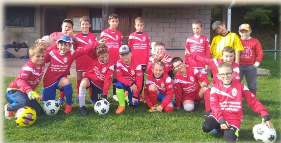
L'équipe des 11 – 12 ans

L'équipe des canonniers du Madon vous souhaite une année pleine de joie,