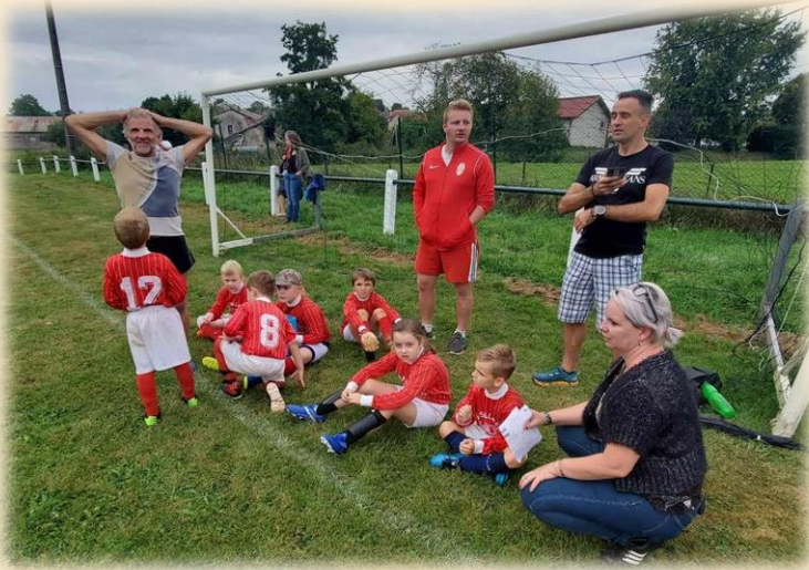
L'équipe des 11 – 12 ans